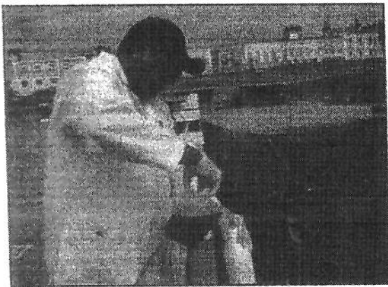
Foto 01: Foz do Igarapé do Mestre Chico/Mirante do Largo do Mestre Chico.