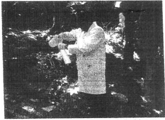
Foto 02: Nascente do Igarapé do Mestre Chico/Viaduto Josué Cláudio de Souza.