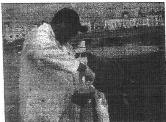
Foto 01: Foz do Igarapé do Mestre Chico/Mirante do Largo do Mestre Chico.