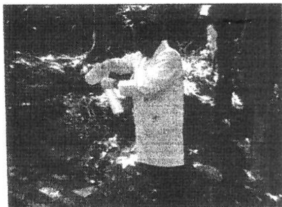
Foto 02: Nascente do Igarapé do Mestre Chico/Viaduto Josué Cláudio de Souza.