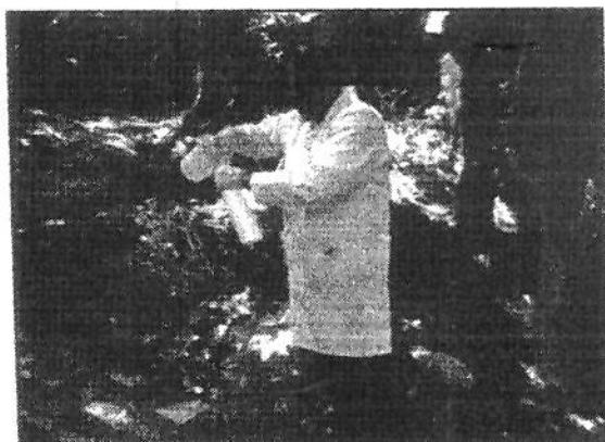
Foto 02: Nascente do Igarapé do Mestre Chico/Viaduto Josué Cláudio de Souza.