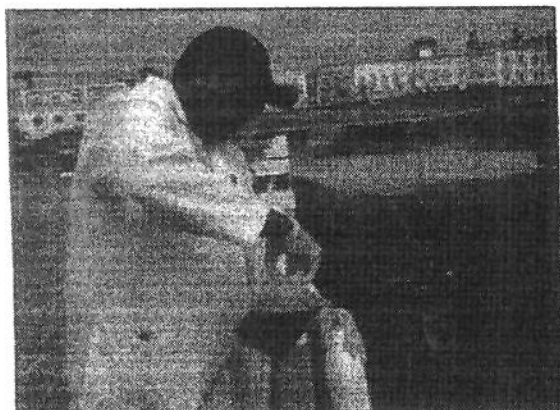
Foto 01: Foz do Igarapé do Mestre Chico/Mirante do Largo do Mestre Chico.